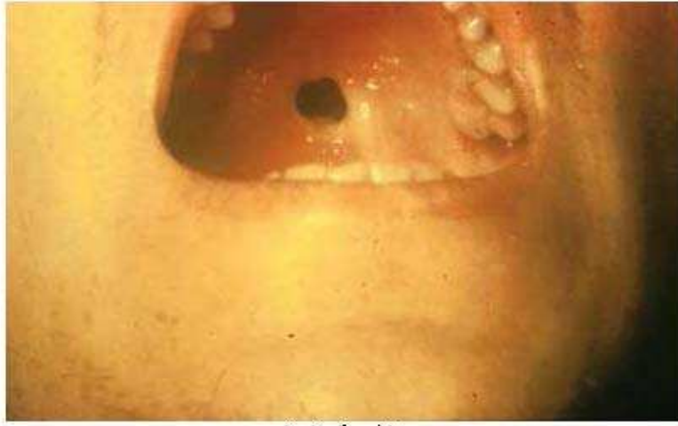
شكل رقم (٩)