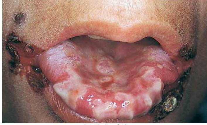
شكل رقم ( ١ )

* نماذج صور من بعض المصابين بمرض الإيدز: هذه الصور أخذت من موقع صيد الفوائد www.saaaid.net