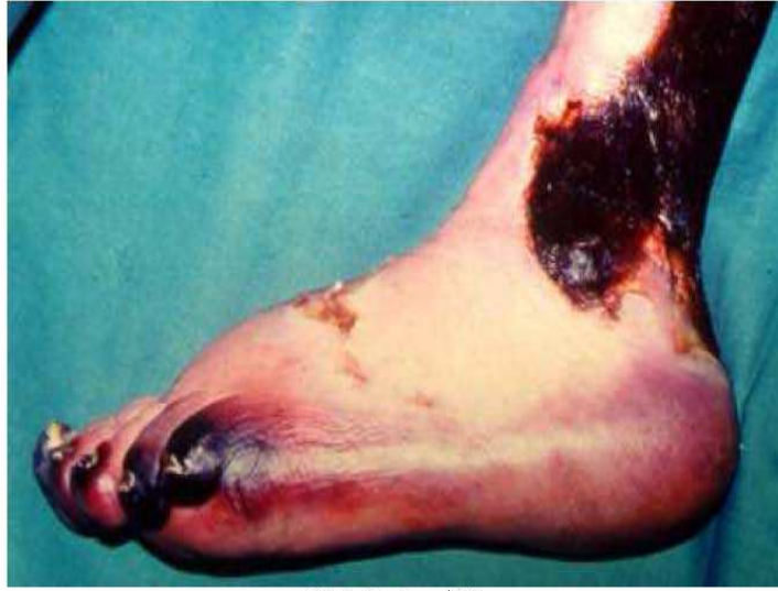
شكل رقم (١١)