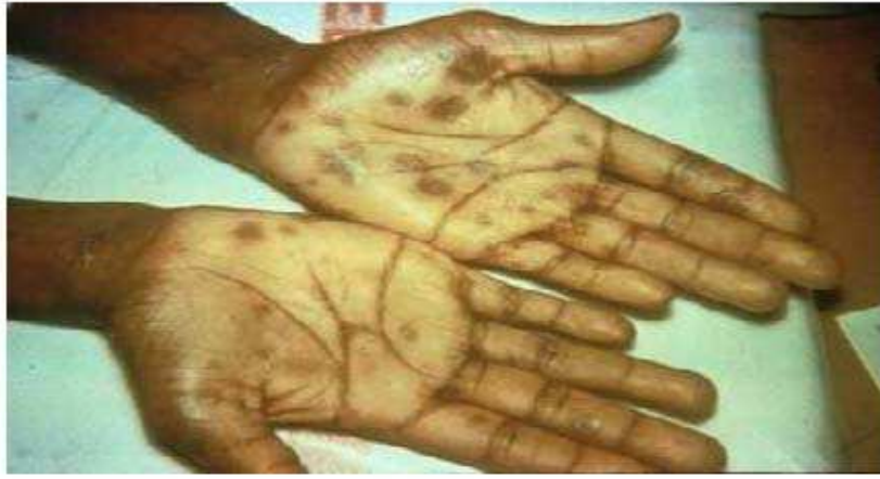
شكل رقم (١٠)